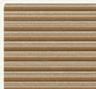
NATURAL BROWN DFD 162 NB