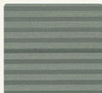
STONE GREY DFD 162 SG