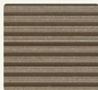
TROPICAL BROWN DFD 162 TB