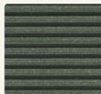
GRAPHITE BLACK DFD 162 GB